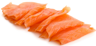
BROODJE WARM GEROOKTE ZALM